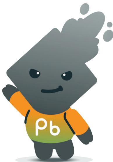
Pibi si Timbal